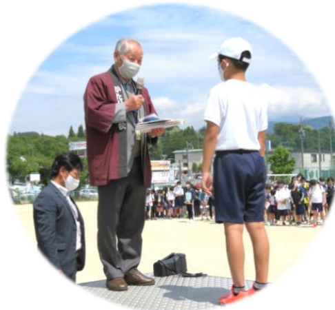
【大井小学校 贈呈式の様子】