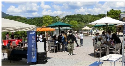
【恵那峡アエルマーケットの様子】