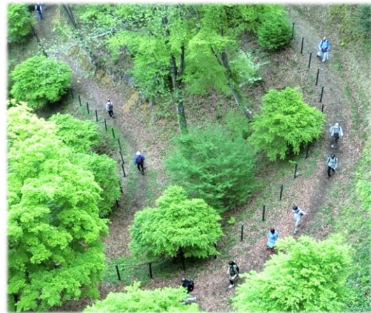
【春の恵那峡満喫ウォーキング】 小雨の降る中でしたが、多くの方が ウォーキングに参加しました。