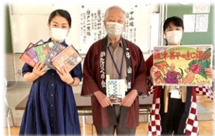
【しぶろく大井宿 歴史文化伝承チームのみなさん】