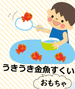
うきうき金魚すくい おもちゃ

【場所】明治天皇大井行在所 駐車場 ※新しく芝生広場のある駐車場が完成 (住所：大井町 80 番地 1)