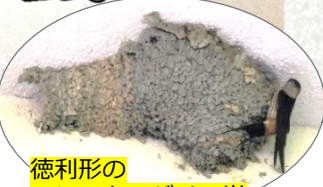
徳利形の コシアカツバメの巣