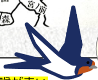
額と喉が赤い 身近なツバメ