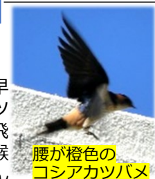
腰が橙色の コシアカツバメ

今年も南の地からツバメが子育てに飛来してきました。大井町にくるツバメの種類は三種類確認できます。最も早く三月末に「ツバメ」その次に「イツツバメ」四月末に「コシアカツバメ」が飛来します。それぞれ特徴があり、額と喉が赤いツバメは一番身近で人家におわん形の巣をつくりますが、喉から腰が白いイツツバメは橋の下に集団で壺形の巣を作ります。腰が橙色のコシアカツバメは比較的高い建物に徳利形の巣をつくります。